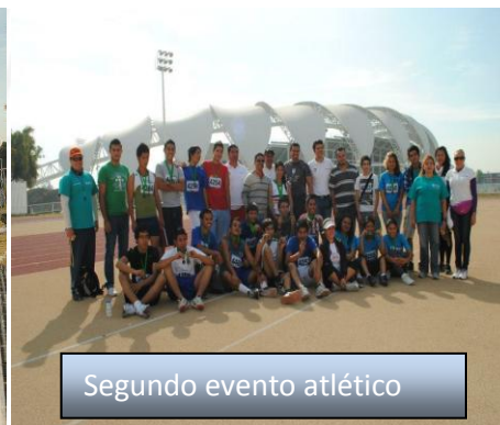
Segundo evento atlético

Periférico Norte s/n Esquina Parr Zapopan Jalisco C.P. 45150 Parque Industrial, Calle 2, Bodega 6 Tels. 31 65 74 44 y 30 55 08 50 Al 53